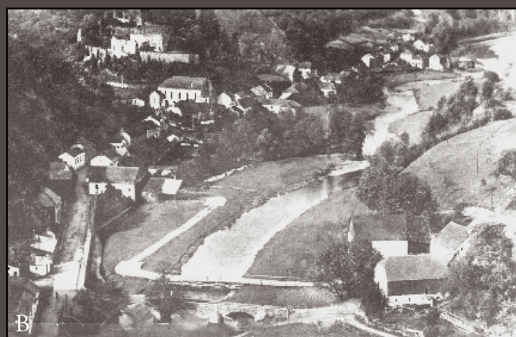
Photo prise vers le 10 mai 1940. L'entrée du pont du côté luxembourgeois étant bloquée par un bloc de béton, la Wehrmacht entra par une passerelle en bois construite par les pionniers allemands. – Le pont n'était pas détruit à l'époque.

On reconnaît le barrage au rectangle sombre au milieu de la rivière. Le canal commence en amont du barrage (C), coule sous le moulin, longe la route et se déverse dans la rivière Our en amont du pont. Le mur de la digue en amont du moulin est en partie éclairé.